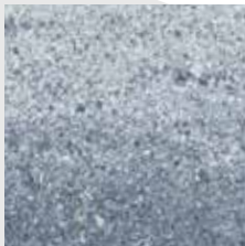
Noir et blanc